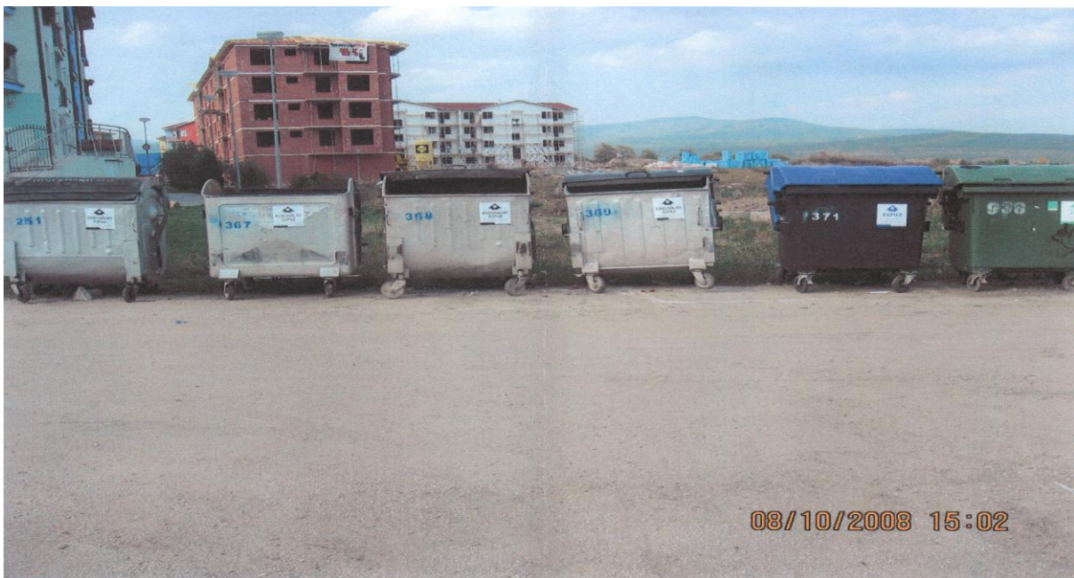
Predložená neaktuálna situácia z r.2008

Predložená informácia je nepravdivá, neaktuálna a súčasné umiestnenie kontajnerového stojiska č.54 nezodpovedá situácii mi predloženej Mestom Pezinok (viď.foto).