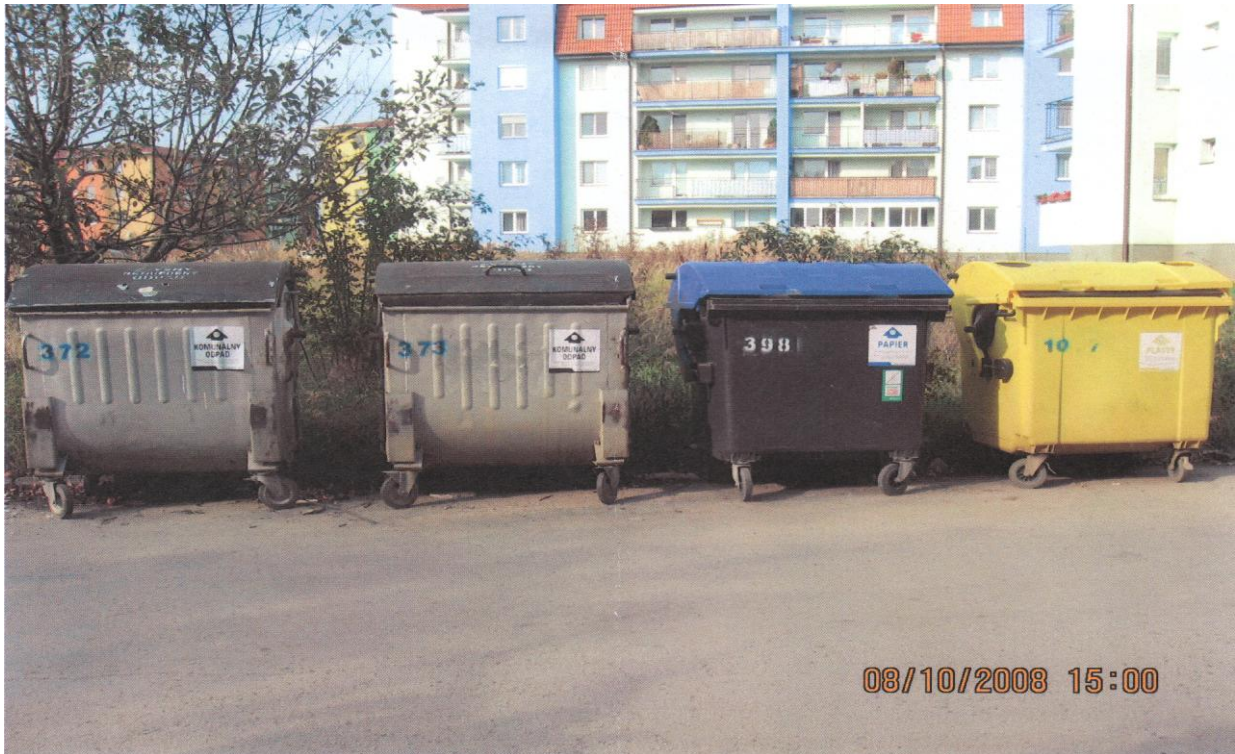
Predložená neaktuálna situácia z r.2008

výstavbe uvedenej stavby podieľala. V prípade reálneho záujmu o vyriešenie tejto situácie, myslím si, že nemal by byť problém pre Mesto Pezinok zistiť si, kto si uvedenú stavbu objednal, zaplatil a teda aj konkrétneho vinníka. Bol by som rád, keby ste ma o záveroch z tohto prípadu informovali.