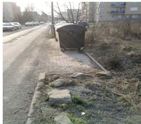
Aktuálna súčasná situácia!!